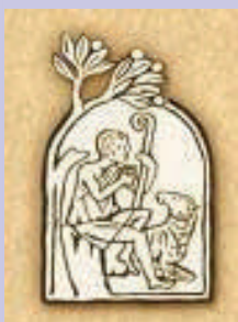
A KATOLIKUS EGYHÁZ KATEKIZMUSA