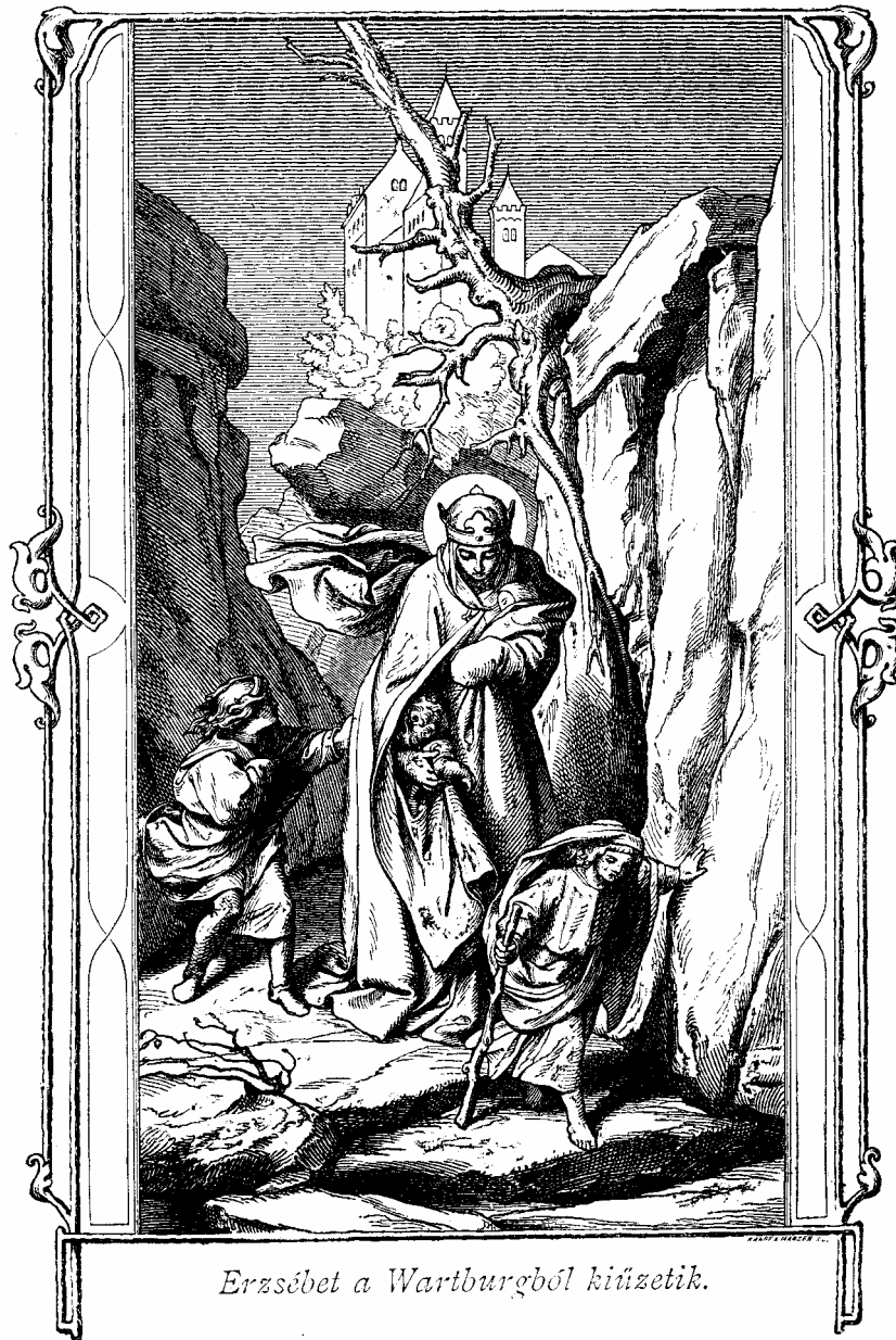
Erzsébet a Wartburgból kiűzetik.

innen nem űzi ki az emberek embertelensége. – De miként az arany is tűzben tisztul, úgy kell az ember lelkének is a szenvedések tűzén keresztül vándorolnia; s Erzsébet pohara még eddig sem telt be!