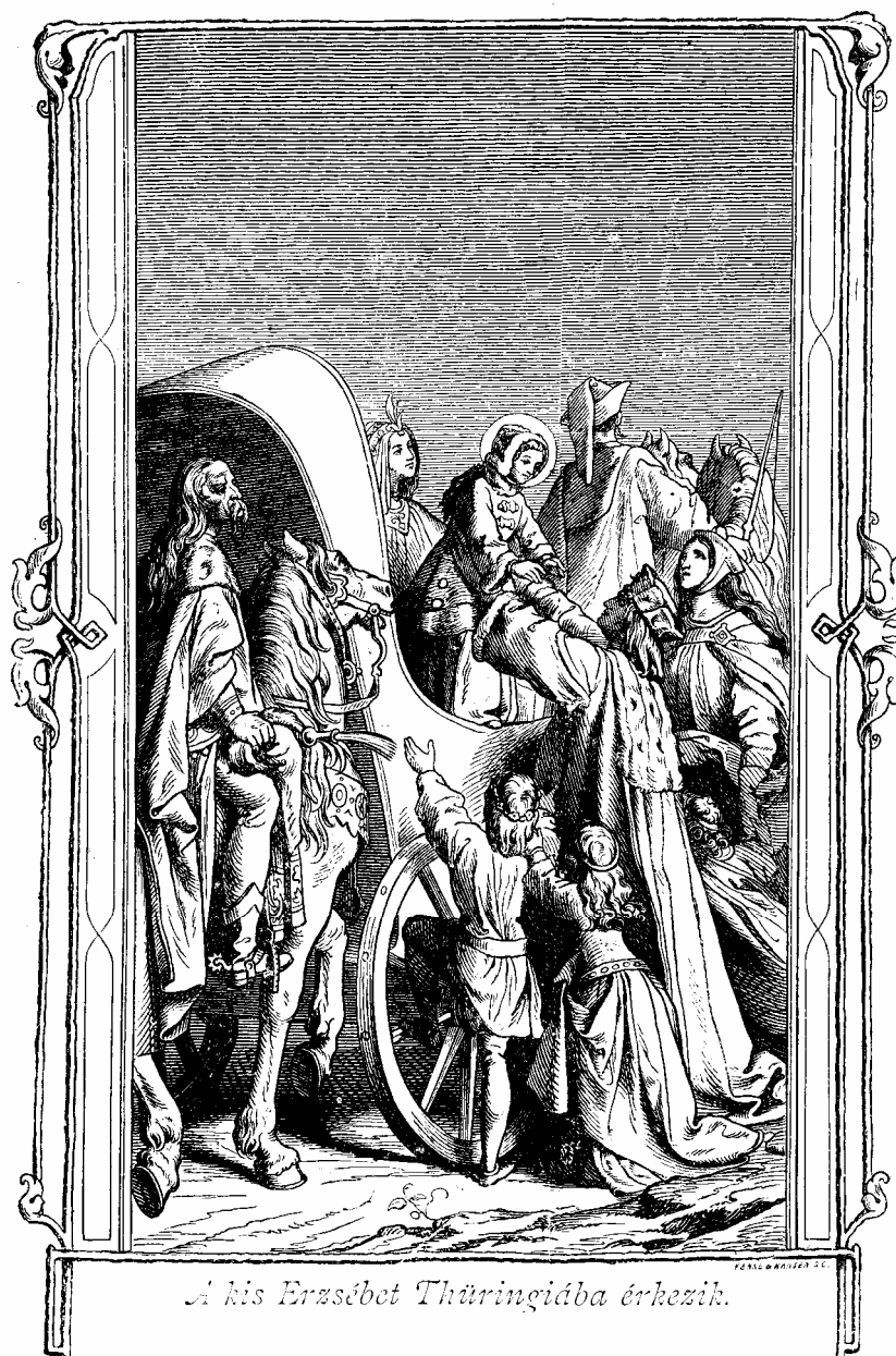
A kis Erzsébet Thüningiába érkezik.

A szokásos előleges eljegyzés nagy ünnepélyességek kíséretében megtartott, örömnapp volt az nagya és apraja számára.