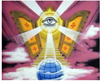
Isten háza és a mennysország kapuja