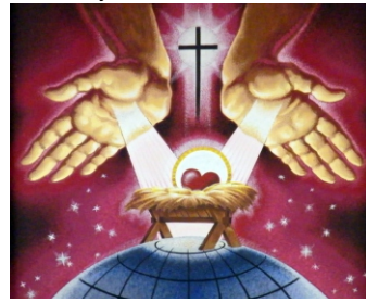
Melyben a mennyei atyának kedve telt