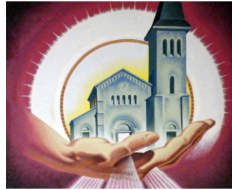
Isten szent temploma