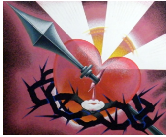
Lánczával átdöfött szív