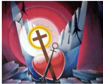
Az igazság és szeretet tárháza