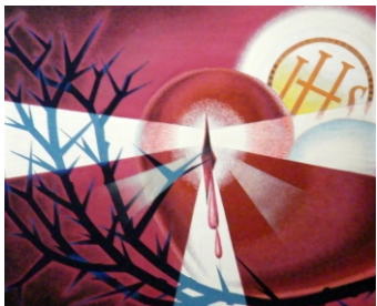
Vétkeinkért megsebzett szív