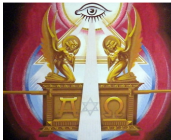
A magasságbelinek szent szekrénye