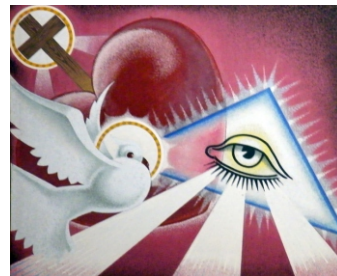
Életünk és feltámadásunk

Jézus szíve szeretlek én, segíts át az élet tengerén! Ha vihar kél fejem felett, legyen oltalmam szelid szíved. Minden veszélyt elűz egy mosolyod, s lelkem megnyugszik, ha veled vagyok.