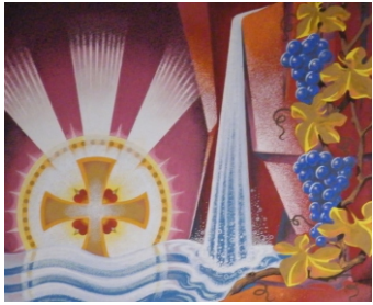
Az élet és szentség forrása