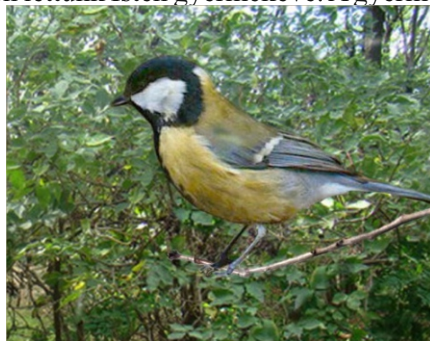
Sík Sándor: Cinege

Elég az gondnak, hogy jó legyen. Mindenkinek, amíg lehetek.