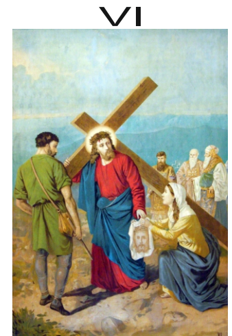
Veronika letörli Jézus arcát

Jézusom, ébressz rá, hogy ha mások terhét hordozom, Neked segíték!