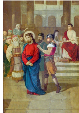
Pilátus halálra ítéli Jézust

Jézusom, ne engedd, hogy embertársaim elítélése miatt ítéletet vonjak magamra!