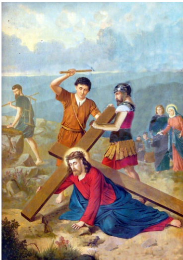
Jézus másodszer esik el

Jézusom, bár fölkelnék én is újra, s ne lépnék már bűnös útra!