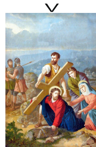
Cirenei Simon segít Jézusnak

Jézusom, édesanyád nem hagyott magadra, hiszen te az övé vagy, ő pedig a tiéd.