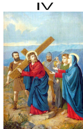
Jézus szent anyjával találkozik

Jézusom, eséseimet tedd lépcsővé, mely följebb visz!