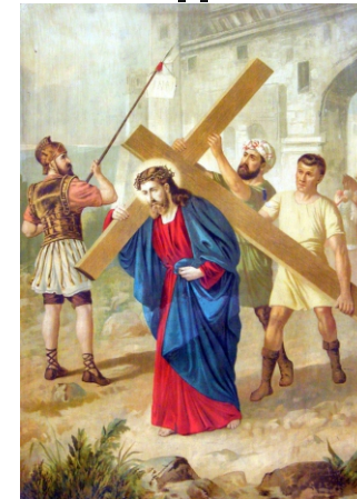
Jézus vállára veszi a keresztet

Jézusom, ne engedd, hogy embertársaim elítélése miatt ítéletet vonjak magamra!