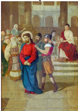
Pilátus halálra ítéli Jézust