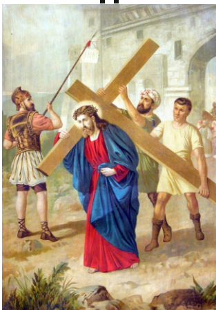
Jézus vállára veszi a keresztet