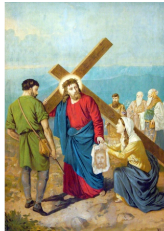
Veronika letörli Jézus arcát

Jézusom, édesanyád nem hagyott magadra, hiszen te az övé vagy, ő pedig a tiéd.