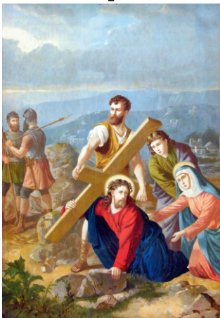
Cirenei Simon segít Jézusnak