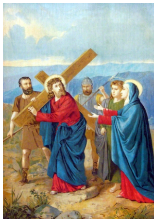
Jézus szent anyjával találkozik