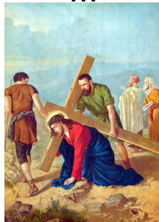
Jézus először esik el a kereszttel

Jézusom, ne engedd, hogy embertársaim elítélése miatt ítéletet vonjak magamra!